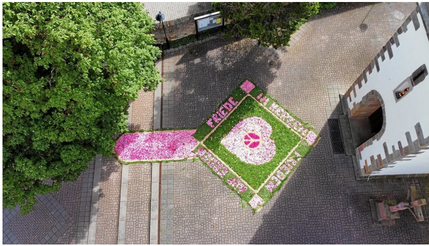
St. Leo Rödersheim