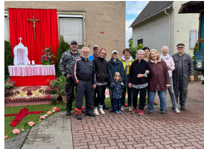
kfd Team St. Leo Rödersheim