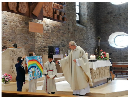
Fronleichnamsmesse in St. Peter Hochdorf