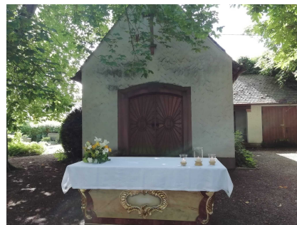
Altar bei der Statio im alten Friedhof Dannstadt