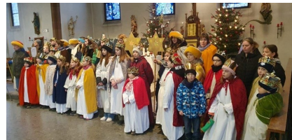
Sternsinger in unseren Gemeinden im Januar 2024.

Liebe Pfarreimitglieder, liebe Leserinnen und Leser unseres Newsletters!