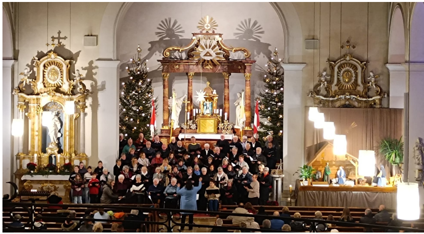
Weihnachtsliedersingen am 29.12.2024 in der Kirche St. Medardus Mutterstadt

Der Junge Chor der Kirchengemeinde Mutterstadt, der Pfarr-Cäcilien-Verein (Kirchenchor) und der gemischte Chor des MGW-Frohsinn hatten eingeladen zum Weihnachtsliedersingen in die katholische Kirche St. Medardus am Sonntag nach Weihnachten. Nach so vielen traurigen Ereignissen in unserer Welt kam eine gute Idee aus den musikalischen Institutionen aus Mutterstadt, bekanntes und altbewährtes Liedgut zu Gehör zu bringen.