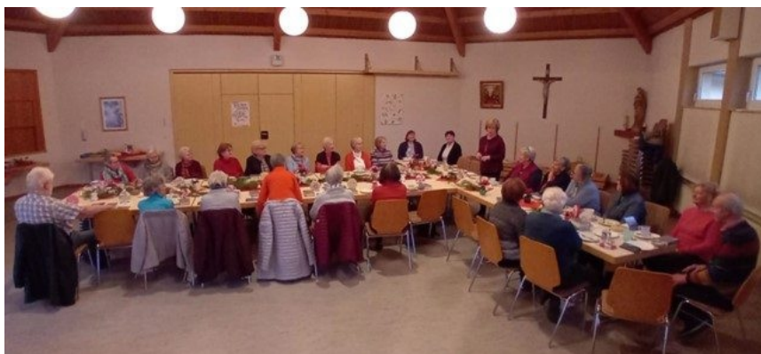
Seniorenbegegnung zu „Auszeit und Genuss“ in Dannstadt im Dezember

Nach der Coronazeit, in denen keine Seniorennachmittage stattfinden konnten, wurden diese im Jahr 2023 einmal im Monat wieder aufgenommen. Recht schnell hatte sich ein Team von sechs Frauen gebildet, das sich über die Gestaltung der Nachmittage Gedanken machte.