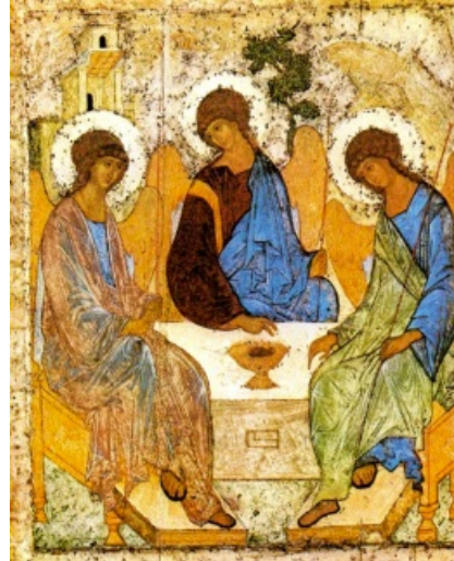
Andrej Rublew Dreifaltigkeit 1422

Fronleichnam ist das Hochfest des Leibes und Blutes Christi . Dieses Fest steht ganz im Zeichen unseres Herrn Jesus Christus, der im Brot des Lebens sich selbst uns schenken will. Jesus ist unser Brot des Lebens, er ist das „Brot, das die Hoffnung“ nährt, er ist die „Freude, die der Trauer wehrt“! Diese Verse stammen aus dem schönen Lied „Brot, das die Hoffnung nährt“ (GL 378).