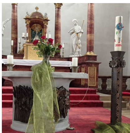
Rote Rosen als Symbol der Liebe schmückten den Altar