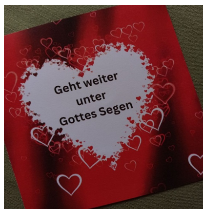
Ein Zuspruch für den weiteren gemeinsamen Weg jedes Paares