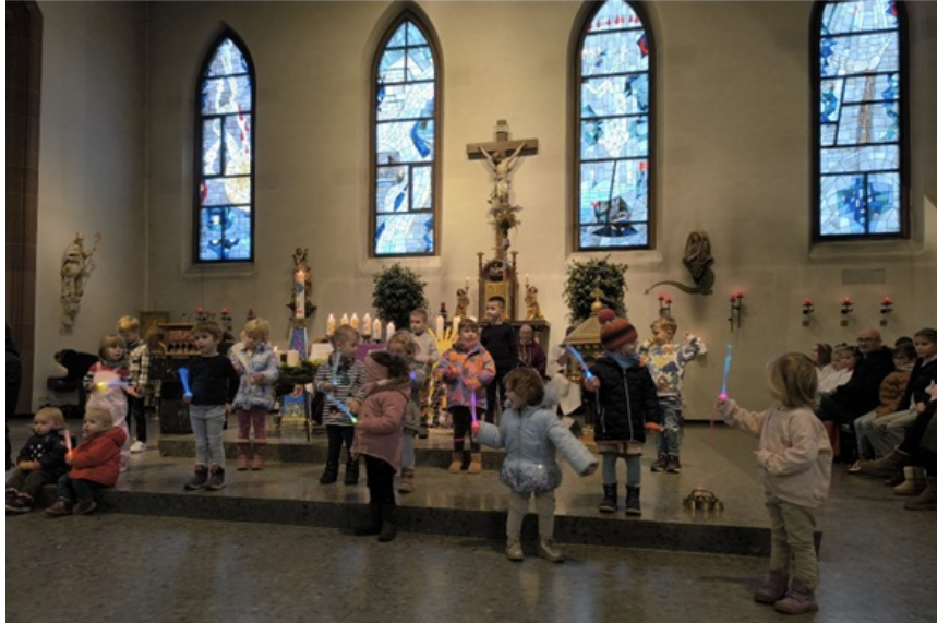
Fröhlicher Lichtertanz der KiTa-Kinder von St. Michael zu Beginn

Liebe Leserinnen und Leser unseres Newsletters,